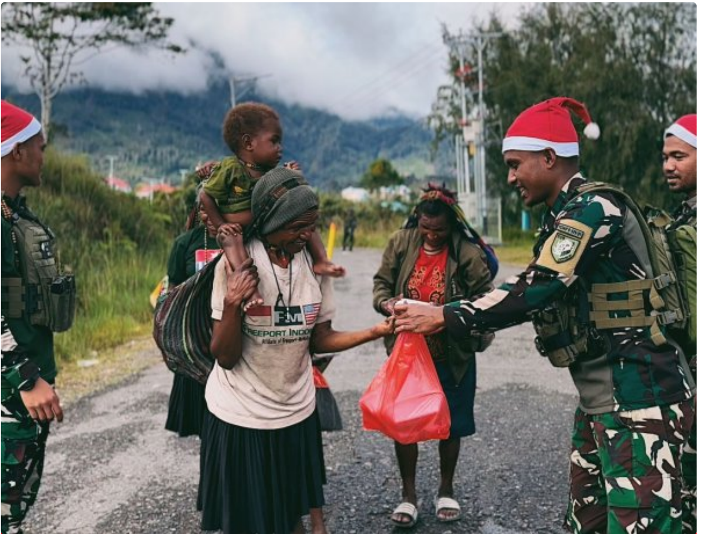
Foto: Satgas Yonif 509 Kostrad memberikan makna baru pada patroli keamanan dengan berbagi kebahagiaan bersama masyarakat di Intan Jaya, Papua.